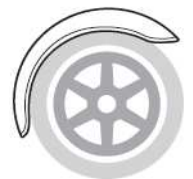
Classic front cycle wings